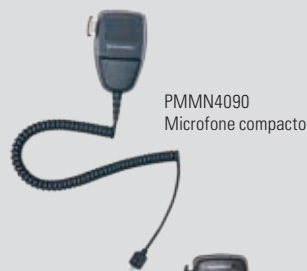
PMMN4090 Microfone compacto