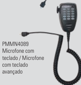
PMMN4089 Microfone com teclado / Microfone com teclado avançado