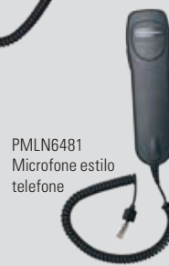
PMLN6481 Microfone estilo telefone