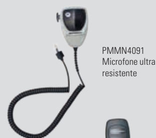
PMMN4091 Microfone ultra resistente